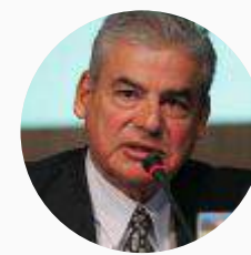
Premier Cesar Villanueva Jefe de Gabinete (Perú)