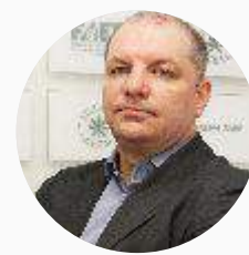
Pedro Loyola Vicepresidente de la Comisión Nacional de Política Agrícola de la CNA (México)