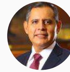
Gustavo Mostajo Ocola Ministro de Agricultura y Riego de PERÚ (Perú)