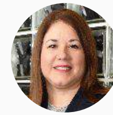
Carla Chiappe Intendente de Supervisión de la SBS (Perú)